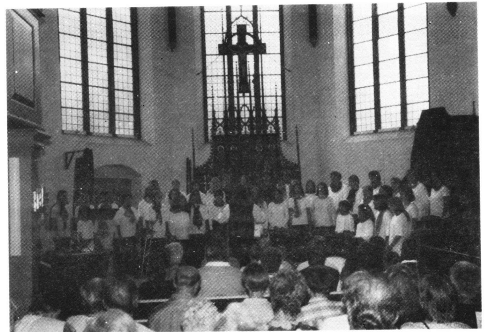
Kinder- und Jugendchor St. Petrus Springe