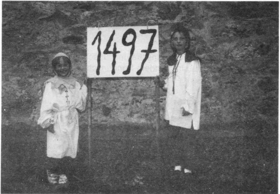
500 Jahre Wittenburger Kirche Bilder der Jubiläumsfeier am 29. Juni 1997

EV. KIRCHENGEMEINDEN WÜLFINGHAUSEN - WITTENBURG